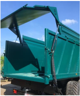
Agromax plus H300